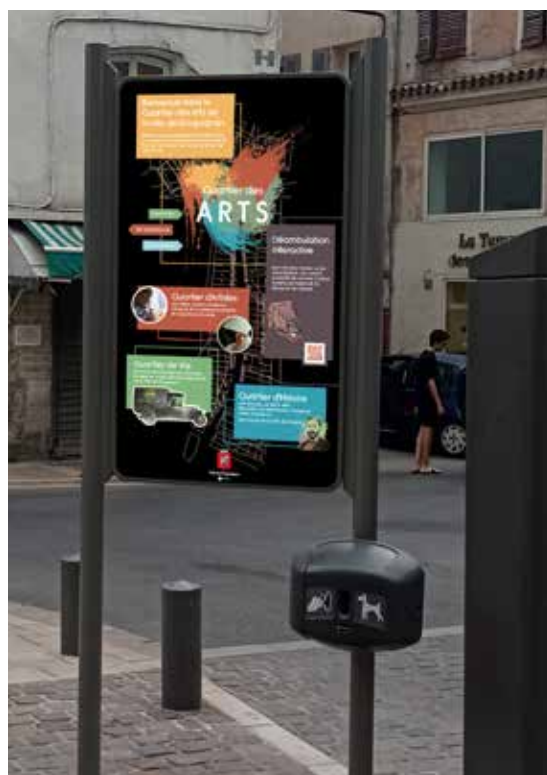
Entrée place du Marché