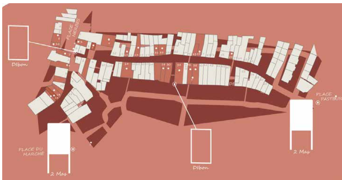
Carte des emplacements de la signalétique