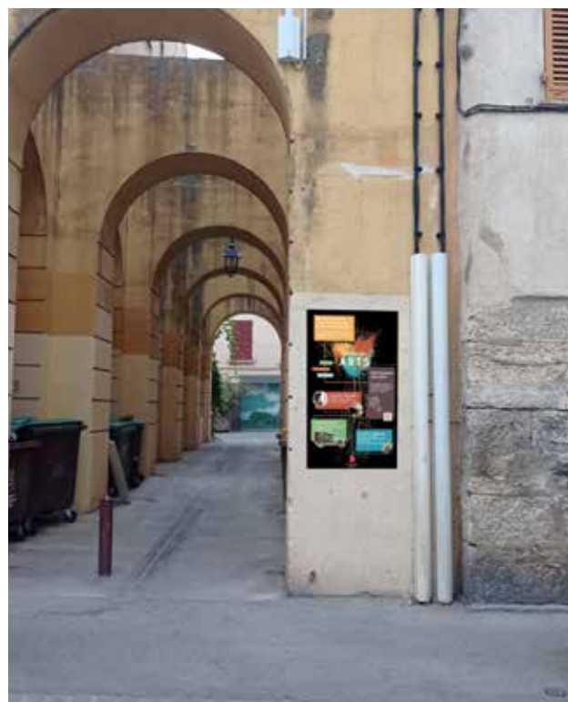
Entrée traverse du Palais