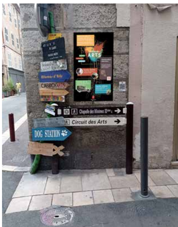
Entrée rue de Trans